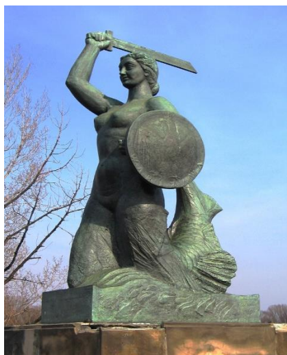
Tydzień autor: Nieznany autor